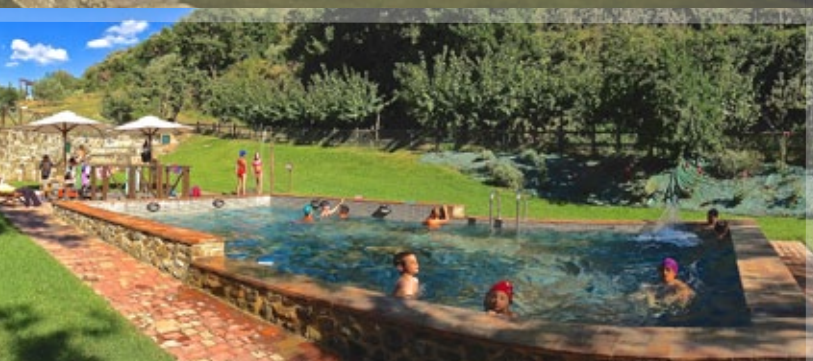
PISCINA • SCHWIMMBAD • POOL