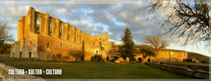
CULTURA • KULTUR • CULTURE