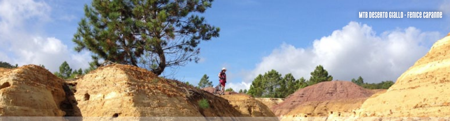
MTB DESERTO GIALLO - FENICE CAPANNE