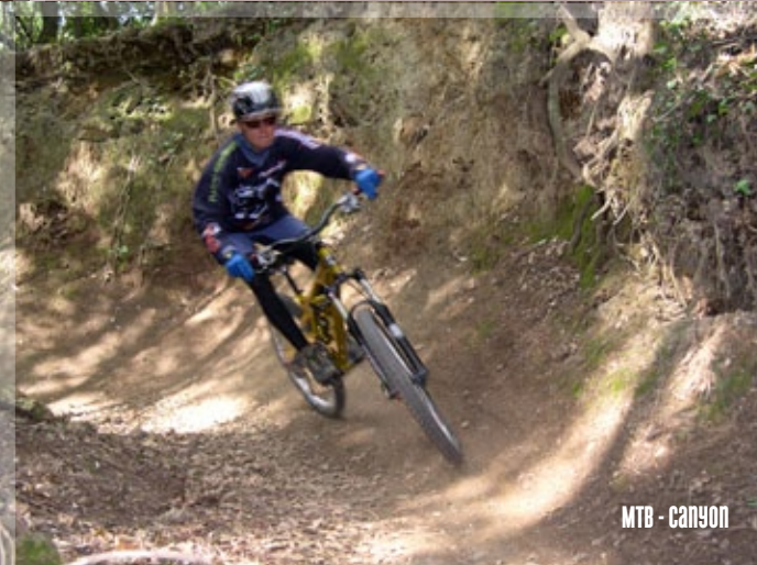
MTB - CANYON